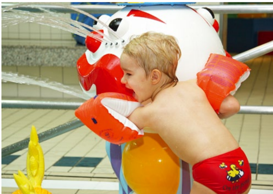
Neben Kinderrutsche und Wasserspielen sorgt Wasserspielzeug, das man sich beim Schwimmmeister ausleihen kann, für Spaß und Abwechslung.

Wer mitmachen will, hinterlässt einfach unter dem Stichwort »Familienbad Heepen« zwischen 30. August und 2. September unter der Rufnummer 0800-100 71 75 seine Anschrift und Telefonnummer. Unter den Anrufern verlosen wir fünf mal zwei Karten. Die Gewinner werden schriftlich benachrichtigt.