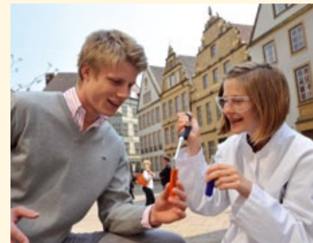
Bielefeld Marketing GmbH

hinter Filmkulissen. Einige Veranstaltungen sind so gefragt, dass man sich anmelden muss. Infos dazu und das volle Programm findet man unter www.geniale-bielefeld.de . Organisiert wird die Geniale vom Wissenschaftsbüro der Bielefeld Marketing und finanziell u. a. von den Stadtwerken Bielefeld unterstützt.