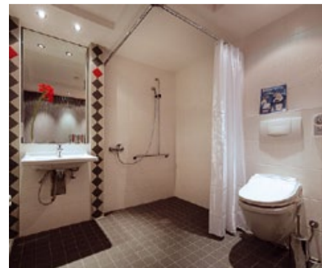
Für Familien mit Kindern, ältere Menschen und Rollstuhlfahrer gleichermaßen komfortabel: ein barrierefreies Bad mit höhenregulierbarem Waschbecken.