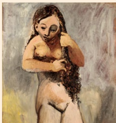
Kimbell Art Museum, Fort Worth, Texas

blau-orange Bimmelbahn dabei idyllische Aussichten und kulturelle Höhepunkte. Im Bauernhaus-Museum etwa läuft noch bis 23. Oktober die Ausstellung »Yes Ei can!«, die das Ei in seiner biologischen, kunst- und kulturhistorischen Bedeutung – manchmal augenzwinkernd, aber immer kenntnisreich – beleuchtet. Mit dem Sparrenmobil geht es auch zur Kunsthalle. Hier werden ab 25. September Werke gezeigt, die Picasso im Jahr 1905 in