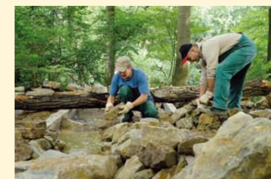
Bau eines Bachlaufs im naturgetreuen Lebensraum des Wolfsgeheges.

Zusätzlich entstand eine kleine Wolfshöhle als Rückzugsmöglichkeit. Ferner erhöht ein Bachlauf mit zwei kleinen Teichen die Attraktivität des Geheges ebenso wie ein Tunnel, der das alte Areal mit dem neuen Gehege verbindet. Doch auch an die Besucherinnen und Besucher wurde gedacht: Sie können die Wölfe intensiv beobachten. In sicherer Höhe von mehr als zwei Metern verläuft diagonal durch die Anlage ein 100 Meter langer Holzsteg – tauglich auch für Kinderwagen und Rollstühle.