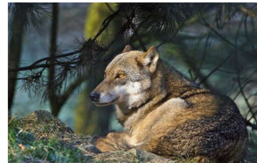
Die Bedeutung der Natur bewusst machen: Natur erleben auf dem Schelphof.