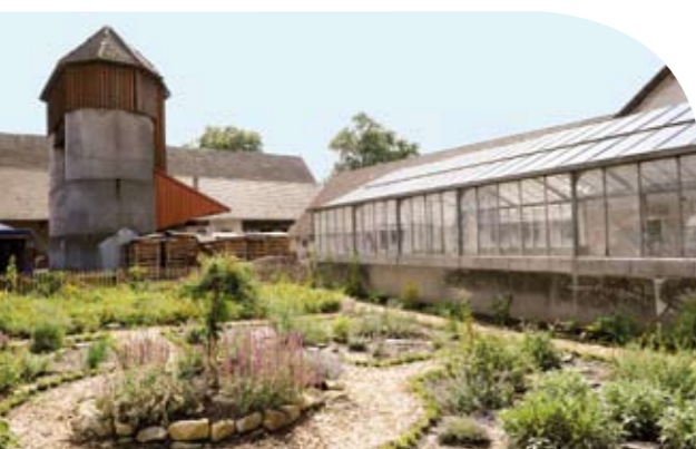
Blühende Vielfalt im neu eingerichteten Bauerngarten.

Inhalt: Arbeiten in und mit der Natur – naturnahe Nachmittagsangebote für Schülerinnen und Schüler Partner: Kinder- und Jugendverband »SJD – Die Falken« Förderdauer: 2008